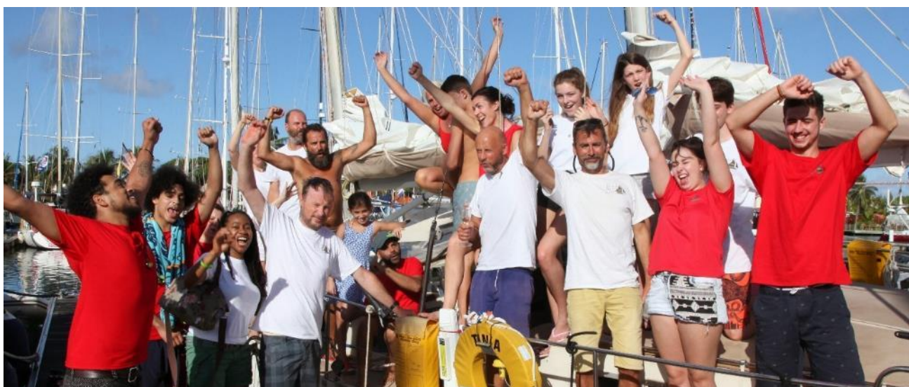
Al llegar a Santa Lucía habiendo completado el cruce Atlántico de 5,000 kms es una increíble sensación de logro para todos los equipos de ARC