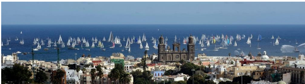
El espectacular salida anual de la ARC desde Las Palmas de Gran Canaria

Todos los jóvenes altamente motivados que buscan una experiencia emocionante y cambiante como parte de un equipo integral están invitados a solicitar esta oportunidad única.